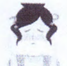
Stare de confuzie