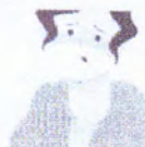
Dificultate la respirație